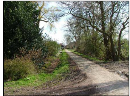
Pieter Koolenstraat: verzorgd beeld versus verrommeling

Een deel van de gewenste verbeteringen kan pas plaatsvinden nadat Van Leijsen is verplaatst en nieuwbouwplannen worden voorbereid. Dit biedt t.z.t. kansen voor het opruimen van de laurierhaag en inpassingen van landschapselementen als het rulletje, groenwallen, singelbeplantingen, knotwilgen en hagen. Ook de plannen voor nieuwbouw aan de westzijde van deze straat, achter De Koppelpaarden, biedt t.z.t. mogelijkheden voor groene inpassingen. Een aparte uitdaging daarbij vormt behoud en inpassing van de vervallen tribune, een gemeentelijk monument. Voorts zijn in de Pieter Koolenstraat diverse eenvoudige maatregelen mogelijk. Grootschaliger is het voorstel om als gemeente een parkzone in te richten en eventueel daarvoor een extra stuk grond aan te kopen.