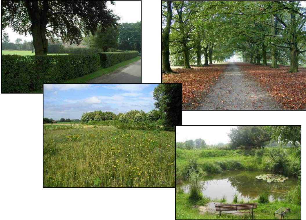
Sfeerbeelden voor het park

Ideaal zou zijn als de gemeente ook het resterende perceel aankoopt, alsook de oude tribune, die in het ontwerp van het park wordt opgenomen. Argument zou kunnen zijn dat de gemeente bij het bestaande MEK de parkeer-voorzieningen binnen de rand van het MEK uitbreidt (en daarmee dus bijdraagt aan een oplossing voor de periodieke parkeeroverlast). De aankoop kan dan worden gezien als compensatie voor dit verlies aan ruimte van het MEK.