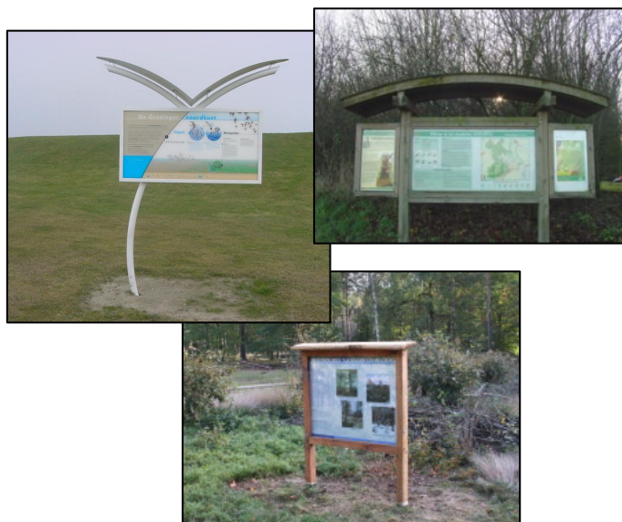
Voorbeelden van informatiepanelen