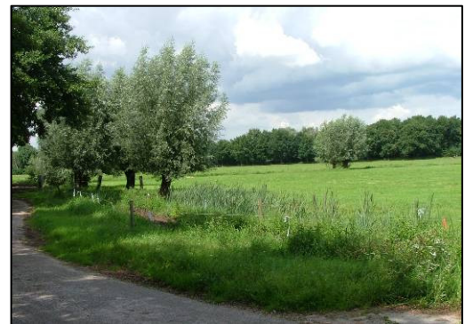
Zicht vanaf de Monnikendreef

Een belangrijk aandachtspunt in beide deelgebieden is een controle op gewenste beheer- en onderhoudsmaatregelen van het groen. Een andere aandachtspunt is de mogelijkheid om weer een fruitboomgaard aan te brengen. Eventueel kan dit alles worden vastgelegd in een apart, eenvoudig groenbeheersplan voor de kloostergronden. Ook nieuwe wensen van de kloosterorde en van Chemin Neuf over beheer en onderhoud kunnen daarin worden betrokken.