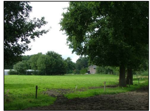
De kloostertuin en het agrarische kloosterlandschap: een integratie van cultuurhistorie, landschapswaarden en natuur

Een belangrijk aandachtspunt in beide deelgebieden is een controle op gewenste beheer- en onderhoudsmaatregelen van het groen. Een andere aandachtspunt is de mogelijkheid om weer een fruitboomgaard aan te brengen. Eventueel kan dit alles worden vastgelegd in een apart, eenvoudig groenbeheersplan voor de kloostergronden. Ook nieuwe wensen van de kloosterorde en van Chemin Neuf over beheer en onderhoud kunnen daarin worden betrokken.