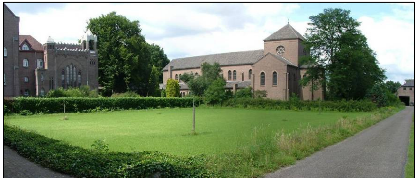
Oostzijde kloostertuin: kans voor een fruitboomgaard?

Ook het agrarische kloosterlandschap heeft, door de kleinschaligheid met zijn groenstructuren (bosjes, hagen, bosstroken, oude bomen) en door de rust, zijn historisch karakter en sfeer grotendeels behouden. Juist het groen in dit agrarische landschap vraagt echter om periodiek onderhoud. Ook hier is het wenselijk om samen met een deskundige van het Brabants Landschap éénmalig de noodzakelijke maatregelen (zoals snoei, vervangingen, aanplant) op korte termijn en op langere termijn in beeld te brengen. Dit omvat dan niet alleen landschappelijke groenmaatregelen, maar hierbij kunnen eventueel ook natuurgerichte maatregelen worden betrokken, zoals het graven van een poel.