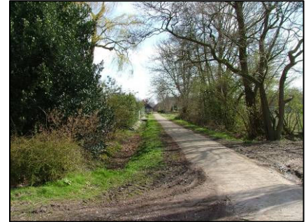
Pieter Koolenstraat: verzorgd beeld versus verrommeling

Een deel van de gewenste verbeteringen kan pas plaatsvinden nadat Van Leijsen is verplaatst en nieuwbouwplannen worden voorbereid. Dit biedt t.z.t. kansen voor het opruimen van de laurierhaag en inpassingen van landschapselementen als het rulletje, groenwallen, singelbeplantingen, knotwilgen en hagen. Ook de plannen voor nieuwbouw aan de westzijde van deze straat, achter De Koppelpaarden, biedt t.z.t. mogelijkheden voor groene inpassingen. Een aparte uitdaging daarbij vormt behoud en inpassing van de vervallen tribune, een gemeentelijk monument. Voorts zijn in de Pieter Koolenstraat diverse eenvoudige maatregelen mogelijk. Grootschaliger is het voorstel om als gemeente een parkzone in te richten en eventueel daarvoor een extra stuk grond aan te kopen.