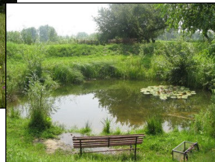
Sfeerbeelden voor het park