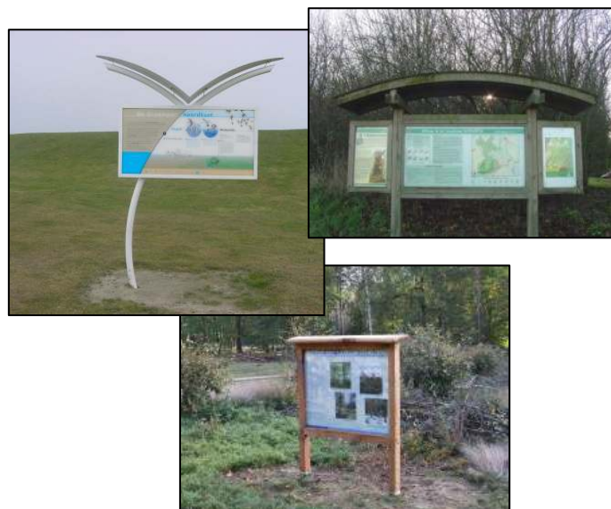
Voorbeelden van informatiepanelen

De gebiedsinformatie wordt door de bezoeker verkregen door de reeds bestaande bordjes op de monumentale gebouwen en door een aantal nieuwe informatiepanelen. Hierop staat meer toelichting, aangevuld met oude foto's, prenten, etc.