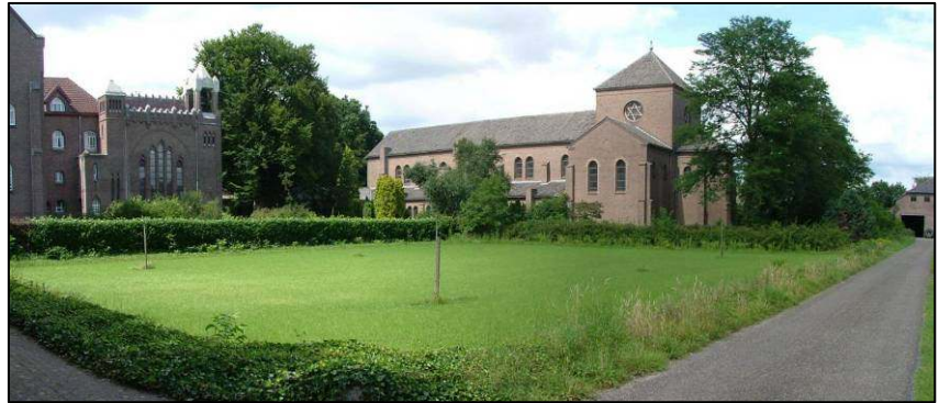
Oostzijde kloostertuin: kans voor een fruitboomgaard?

Ook het agrarische kloosterlandschap heeft, door de kleinschaligheid met zijn groenstructuren (bosjes, hagen, bosstroken, oude bomen) en door de rust, zijn historisch karakter en sfeer grotendeels behouden. Juist het groen in dit agrarische landschap vraagt echter om periodiek onderhoud. Ook hier is het wenselijk om samen met een deskundige van het Brabants Landschap éénmalig de noodzakelijke maatregelen (zoals snoei, vervangingen, aanplant) op korte termijn en op langere termijn in beeld te brengen. Dit omvat dan niet alleen landschappelijke groenmaatregelen, maar hierbij kunnen eventueel ook natuurgerichte maatregelen worden betrokken, zoals het graven van een poel.