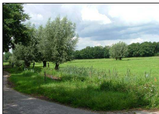
Zicht vanaf de Monnikendreef

Een belangrijk aandachtspunt in beide deelgebieden is een controle op gewenste beheer- en onderhoudsmaatregelen van het groen. Een andere aandachtspunt is de mogelijkheid om weer een fruitboomgaard aan te brengen. Eventueel kan dit alles worden vastgelegd in een apart, eenvoudig groenbeheersplan voor de kloostergronden. Ook nieuwe wensen van de kloosterorde en van Chemin Neuf over beheer en onderhoud kunnen daarin worden betrokken.