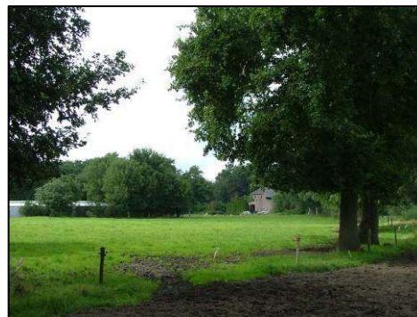
De kloostertuin en het agrarische kloosterlandschap: een integratie van cultuurhistorie, landschapswaarden en natuur

Een belangrijk aandachtspunt in beide deelgebieden is een controle op gewenste beheer- en onderhoudsmaatregelen van het groen. Een andere aandachtspunt is de mogelijkheid om weer een fruitboomgaard aan te brengen. Eventueel kan dit alles worden vastgelegd in een apart, eenvoudig groenbeheersplan voor de kloostergronden. Ook nieuwe wensen van de kloosterorde en van Chemin Neuf over beheer en onderhoud kunnen daarin worden betrokken.