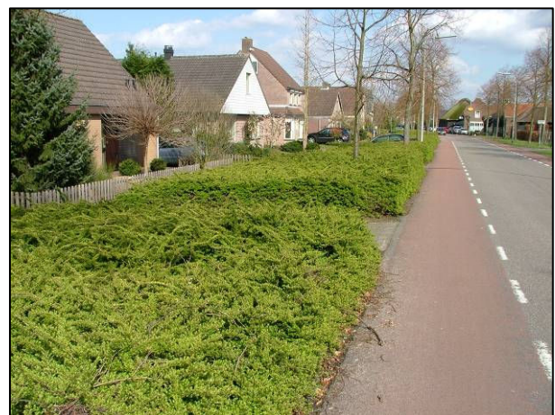
Huidige heesterbegroeiing in plantsoenen langs de Veerseweg.

De huidige boombeplanting vormt thans het belangrijkste groene raamwerk van de Veerseweg. Met de groei van de bomen zal de verdichting (zoals gewenst in het Groenplan) op termijn toenemen. Zonder in termen als 'mooi' en 'lelijk' te verzanden is het discutabel of de huidige bodembedekkende heesterbegroeiing in dit groenbeeld als 'noordrand van de Heilige Driehoek' past. Deze zou eventueel omgevormd kunnen worden tot meer soort- en structuurrijke plantsoenen. Hiervoor bestaan diverse mogelijkheden. De meningen van de bewoners zijn hierbij echter belangrijk. Derhalve wordt in dit projectvoorstel geen inhoudelijk plan uitgewerkt, maar wordt voorgesteld om samen met de bewoners te bekijken of aanpassingen wenselijk zijn en zo ja, hoe het groen in deze plantsoenen dan aangepast wordt.