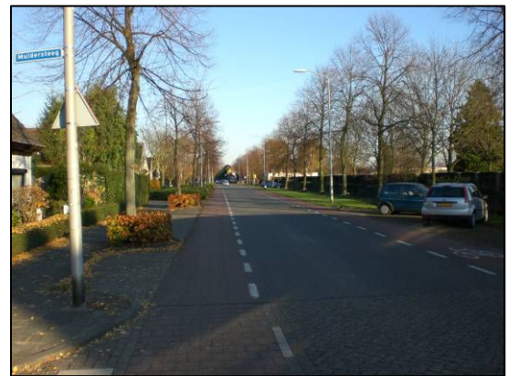
De huidige Veerseweg geeft geen indruk en sfeer als noordgrens van de Heilige Driehoek.

Dit projectvoorstel geeft daartoe enkele mogelijkheden die deels op korte termijn realiseerbaar zijn. Voorts worden enkele overwegingen gegeven om ook het groen langs de randen van de bestaande begraafplaats aan te passen. Het is een meerwaarde als de bewoners tijdens dit project worden betrokken en uitgedaagd om ook het ontwerp van hun tuinen meer af te stemmen op opgaande groenstructuren, bij voorkeur met gebruik van inheemse soorten.